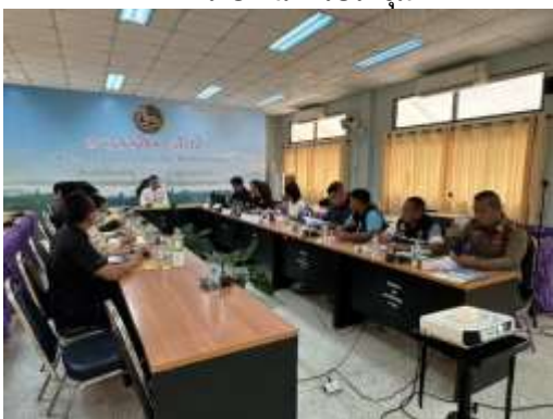
บรรยากาศผู้เข้าร่วมประชุมรับฟังการบรรยาย