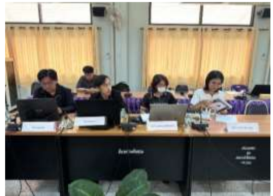
กลุ่มบริษัทที่ปรึกษา นำเสนอรายละเอียดโครงการ